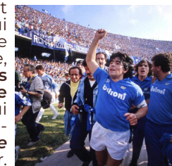
Figure incontournable de l'histoire du football et véritable icône populaire à Naples, Diego Maradona sera lui aussi présent à la Foire... du moins à travers sa statue ! Au cœur du Village Italien, un espace spécialement aménagé lui rendra hommage. Inspiré des autels que l'on trouve dans les rues de Naples, où l'Argentin est encore aujourd'hui vénéré comme une véritable légende, ce lieu retracera les grandes étapes de la carrière de celui que l'on surnommait "El Pibe de Oro", le Gamin d'Or.

Arrivé au SSC Napoli en 1984, Diego Maradona a profondément marqué l'histoire du club et de la ville, disputant plus de 250 matchs sous les couleurs napolitaines entre 1984 et 1992.